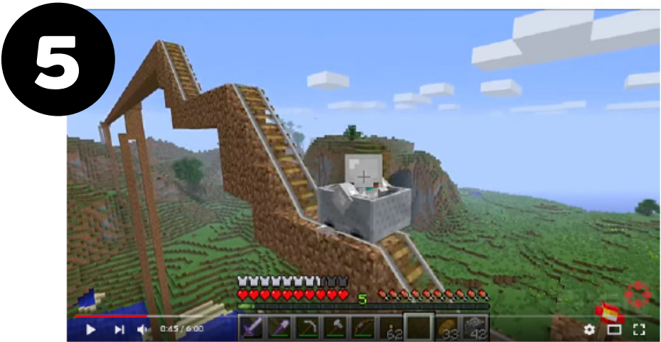
IGN REVIEWS 22 • 8121 IGN Reviews - Full Minecraft Review

Βαθμολογήστε τις πέντε πηγές πληροφοριών από τις πιο αξιόπιστες έως τις λιγότερο αξιόπιστες. Μπορείτε να εξηγήσετε πώς κάνατε την απόφασή σας;