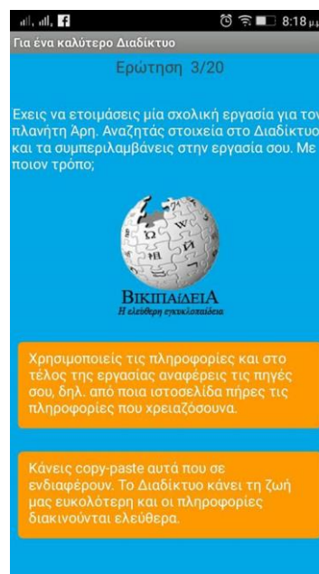
Εικόνα 1: Στιγμιότυπο οθόνης

Η γκάμα των ερωτήσεων καλύπτει ένα μεγάλο εύρος των θεμάτων που τίθενται στην Διαδικτυακή Ασφάλεια. (βλ. Παράρτημα)